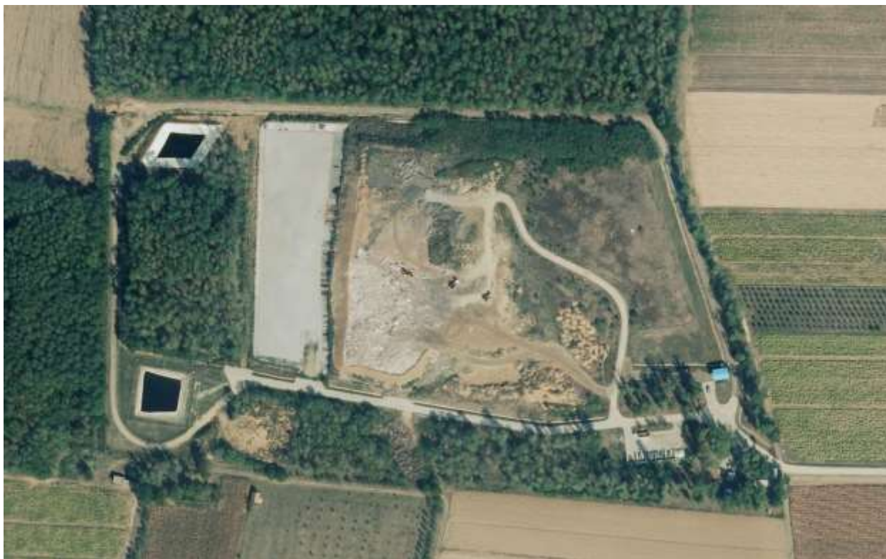
Slika 1. Orto-foto karta s prikazom lokacije postrojenja i područja koje ga okružuje